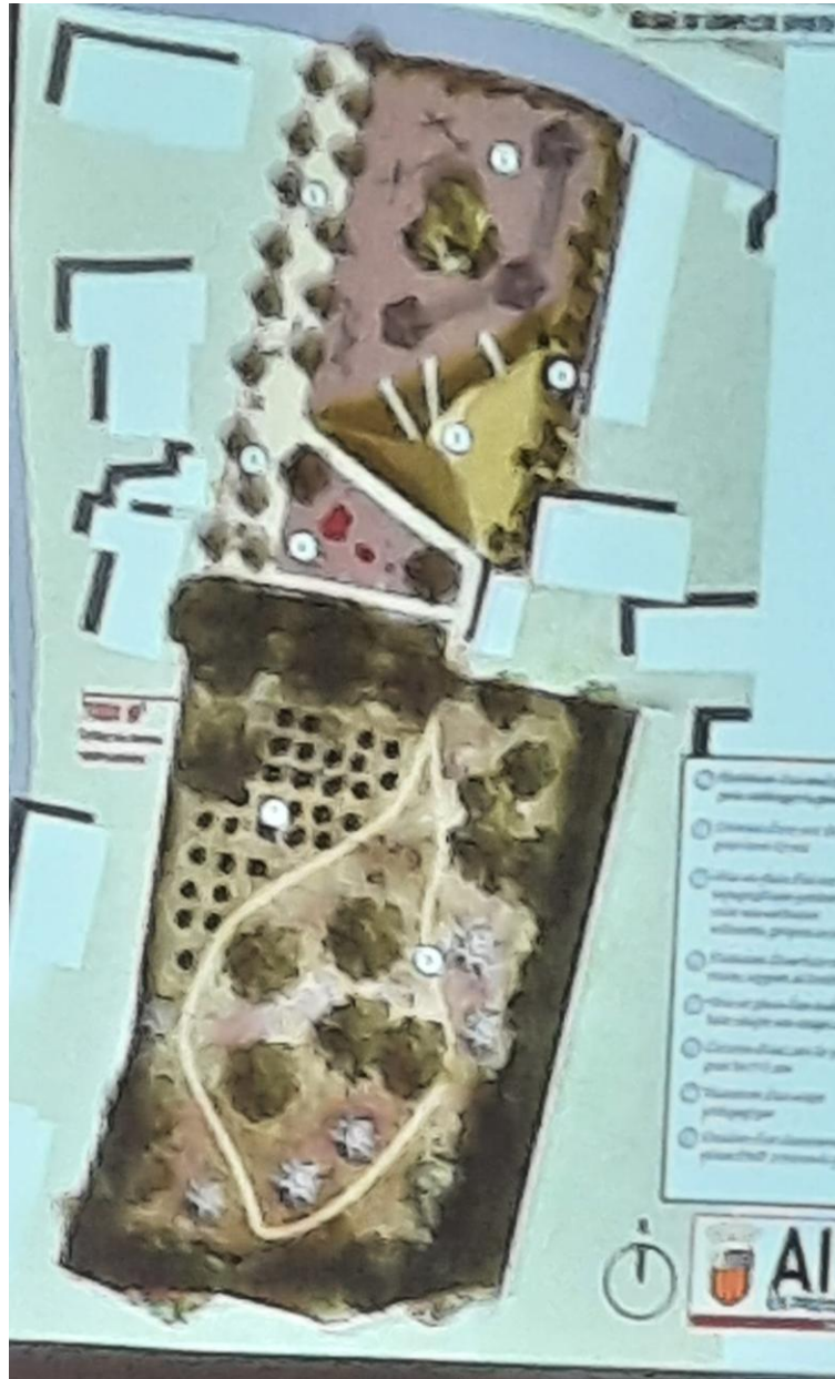
Square Constant en foncé A gauche en clair, le terrain de 3000M2 donné à bail à AMS pour 3ans reconductibles